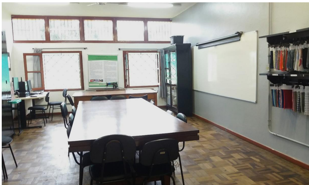
Figura 1: Espaço físico da Tecidoteca IFSUL CAVG