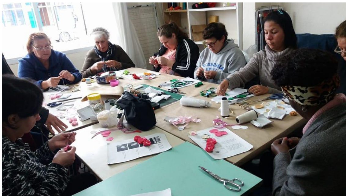
Figura 5: Oficina de Artesanato realizada com o grupo de economia solidária da Associação FRAGET

Em O artifício, Richard Sennett descreve o artesanato como “o desejo de fazer bem um trabalho como um fim em si mesmo”. Essa motivação traz a promessa de recompensas emocionais, vincula as pessoas à realidade material e permite que sintam orgulho de seu trabalho. Por todas essas razões – por sua conexão com os recursos, por sua qualidade ativa e concreta, pelo valor que deposita na experiência vivida e consolidada e na satisfação emocional -, o artesanato abriga muitos valores de sustentabilidade. (FLETCHER E GROSE, 2011, p. 146).