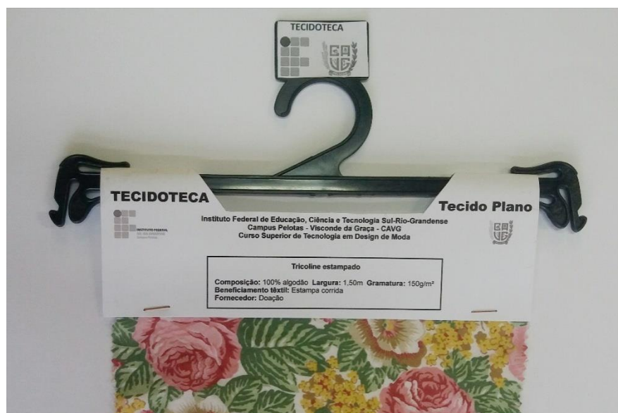
Figura 3: Tags de catalogação das bandeiras têxteis

O Tag fixado em cada bandeira contém as seguintes informações: nome do tecido, largura, gramatura, rendimento (para malhas), composição e fornecedor (figura 3).