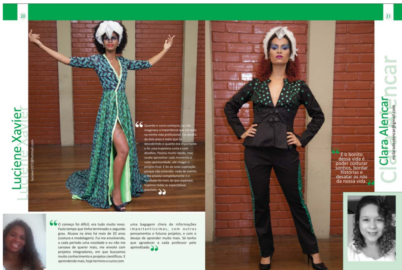
Figura 3. Página visualização de capa e página interna da revista.

A revista foi distribuída para todos os envolvidos no projeto: G.R.E.S Gigante do Samba, modelos, parceiros, alunos e instituição de ensino.