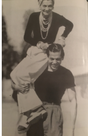
Chanel e Serge Lifar