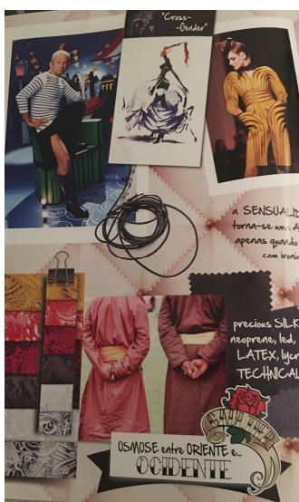
Montagem pag22 coleção Folha Moda de a a z vol 9 Folha de São Paulo, 2015