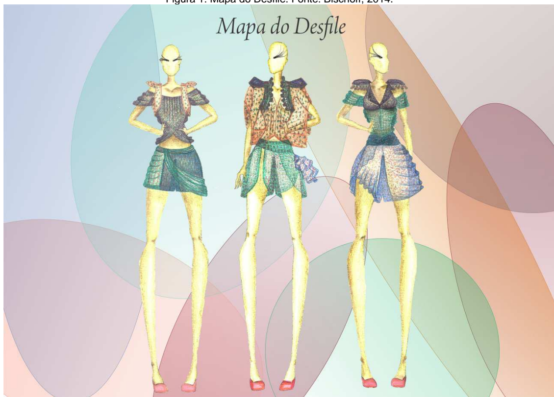
Figura 1: Mapa do Desfile.

No projeto detalhado se elaborou os desenhos técnicos (LEITE 2004) dos vinte e cinco (25) looks das coleções conceitual e comercial, e definiu-se o release da coleção, que se distingue do texto conceito por ter funções jornalísticas, pode “(...) ser enviado à imprensa e aos empregadores ou compradores potenciais.” (JONES, 2005, p. 185). Paralelamente desenvolveu-se o press-kit e escolheu-se a trilha sonora e a produção do desfile.