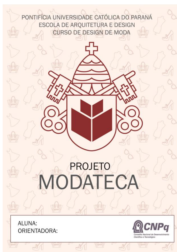
Figura 1. Capa da apostila das fichas da Modateca PUCPR.

Para que o projeto demonstrasse harmonia gráfica, as fichas e layout foram criados com o auxílio do programa Adobe Illustrator , tendo como base as fichas utilizadas no projeto Modateca da UDESC.. Sobre o Design Gráfico na moda, Martins (2010) afirma que “[...] o design pode estar na estampa da camiseta como na produção de um catálogo da coleção.”, ou seja, o design gráfico pode ser inserido de diversas formas no âmbito da moda, inclusive na criação das fichas, como é o caso do presente projeto.