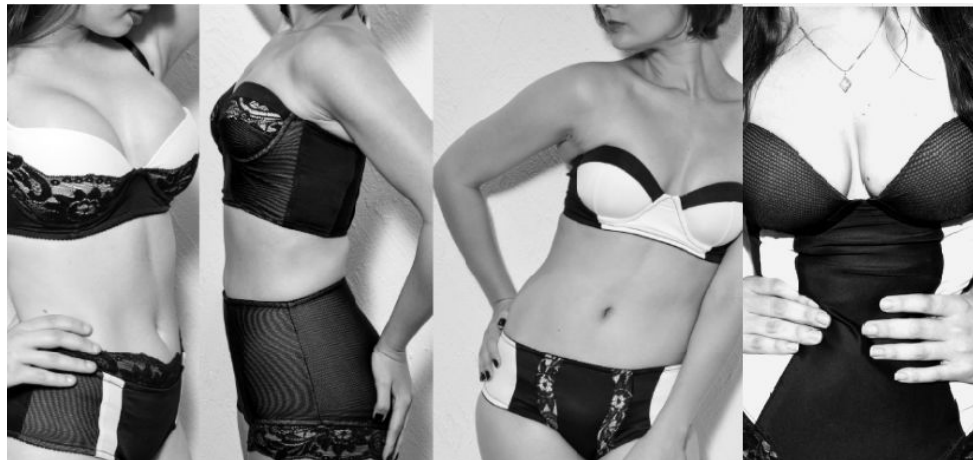
Figura 3: Lingerie Funciona Coleção!