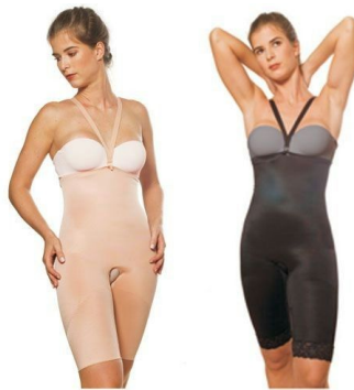
Figura 1: Lingerie modeladora

A partir dessa informação o trabalho investigou na modelagem um caminho para valorizar o corpo feminino criando uma nova linguagem a um produto que carece de estética diferenciada.