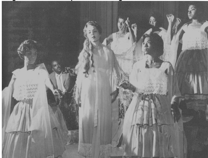
Figura 14- Foto do espetáculo Sortilégio . 1957.

formal europeu/branco e o tradicional africano/negro. O recado do TEN fica claro- as tradições da cultura africana estão impregnadas na cultura brasileira.