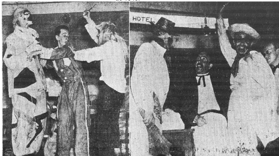
Figura 1- Fotos do espetáculo Revista Penitenciária. O espetáculo foi apresentado em 12 de outubro de 1943.

Como se vê na figura 01, os trajes são de fácil confecção, trajes tradicionais de espetáculos ligeiros, como muitos do teatro de revista: números curtos, engraçados, com muita música e diversão. Claro que não se pode deixar de lado as condições adversas em que foram produzidos, dentro do presídio. Estavam ali a roupa costumeira do palhaço remendado (provavelmente colorida) e o traje de caipira, de chapéu e lenço.