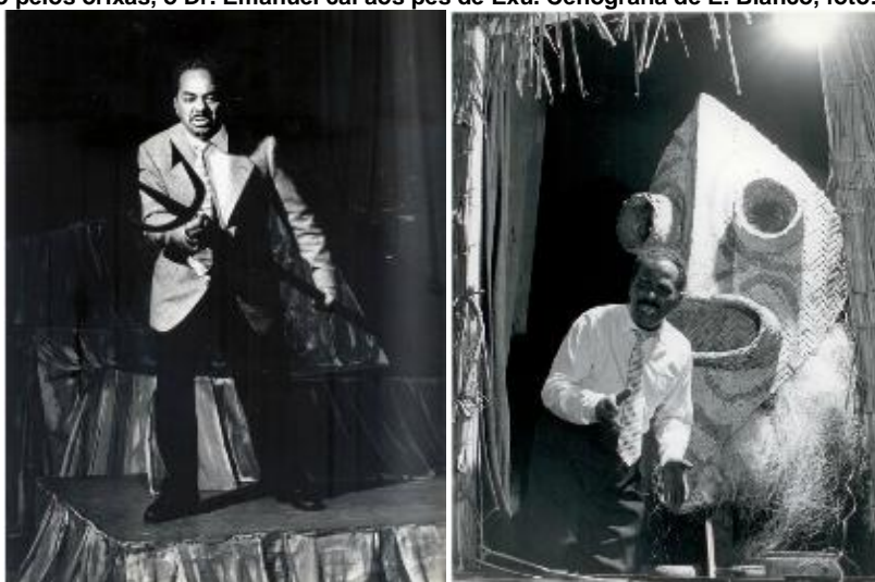
Figura 12- O “Dr. Emanuel” empunha o garfo de Exú para lutar contra as visões fantásticas. Na figura 13, vencido pelos orixás, o Dr. Emanuel cai aos pés de Exú. Cenografia de E. Bianco, foto: Carlos.

O espetáculo traz macumba, batidas de tambor e atabaques, fumaça, alucinações, descobertas e... trajes africanos! O protagonista veste terno (ver figuras 12 e 13) e o elenco todo traja roupas rituais da umbanda. Fica assim registrado o conflito do protagonista até mesmo na oposição entre os trajes- o