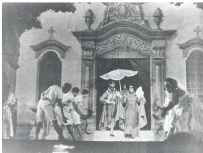
Figura 11- “Maracatu”, quadro de Rapsódia Negra, show de Abdias Nascimento. Ao centro, o Rei e a Rainha. 1952.

Nessa direção, Sortilégio fecha a trajetória do Teatro Experimental do Negro e nada poderia ser nem mais apropriado e nem mais contemporâneo e inquietante. O espetáculo é protagonizado por um negro, em conflito com sua própria condição social e aquilo que sobrou das raízes de seus ancestrais- seus ritos, sua cultura, suas vivências.