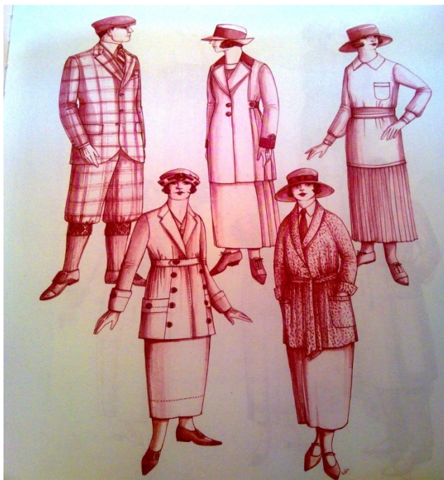
Figura 1: Silhueta do pós-guerra 1914-1929

pois com a guerra houve a desaceleração da economia. Algo que resultou diretamente na mudança de estilo de vida de homens e mulheres, que passaram a dedicar-se a lutar na guerra e no caso das mulheres, a sua inserção no mercado de trabalho. Com isso, desenvolvemos proposta da peça se tornar adaptável para qualquer ambiente e não só para o trabalho, como era a ideia do pós-guerra, mas que acrescido a outros tipos de materiais, se tornasse confortável e requintado.