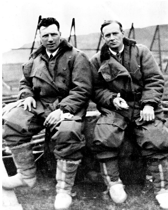
Figura 2: Captain John Alcock and Lieutenant Arthur Whitten Brown. 1919