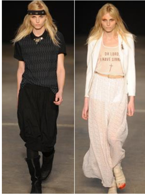
Figura 2. Andrej Pejic para a marca Aüslander

Para Lotufo (2011), o fenômeno é um reflexo dos tempos atuais. A moda sempre foi pioneira em antecipar tendências e costumes, mas não nos esqueçamos de Maria Antonieta e seus culotes equestres, ou de Diane Keaton e seus coletes e gravatas no filme ‘Noivo Neurótico, Noiva Nervosa’, porém atualmente é a indumentária masculina que incorpora elementos até então femininos, como as camisetas com profundos decotes em “V” ou mesmo as calças skinnies .