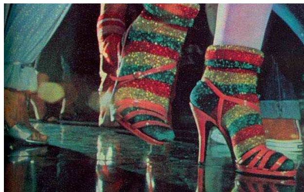
Figura 2. Meias em lurex