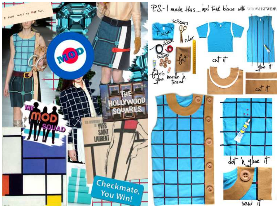
Figura 1: painel de tendências que dá origem a peça “customizada”.

É inerente ao ser humano a necessidade de se expressar, de se comunicar. A moda, por sua vez, é comunicação. A vestimenta fala através do usuário. Neste sentido, se o vestuário de moda agregar um design sustentável, aquele que o veste estará por sua vez comunicando que é um sujeito responsável e consciente, preocupado com as questões ambientais, a preservação do meio em que vive e o destino das futuras gerações.