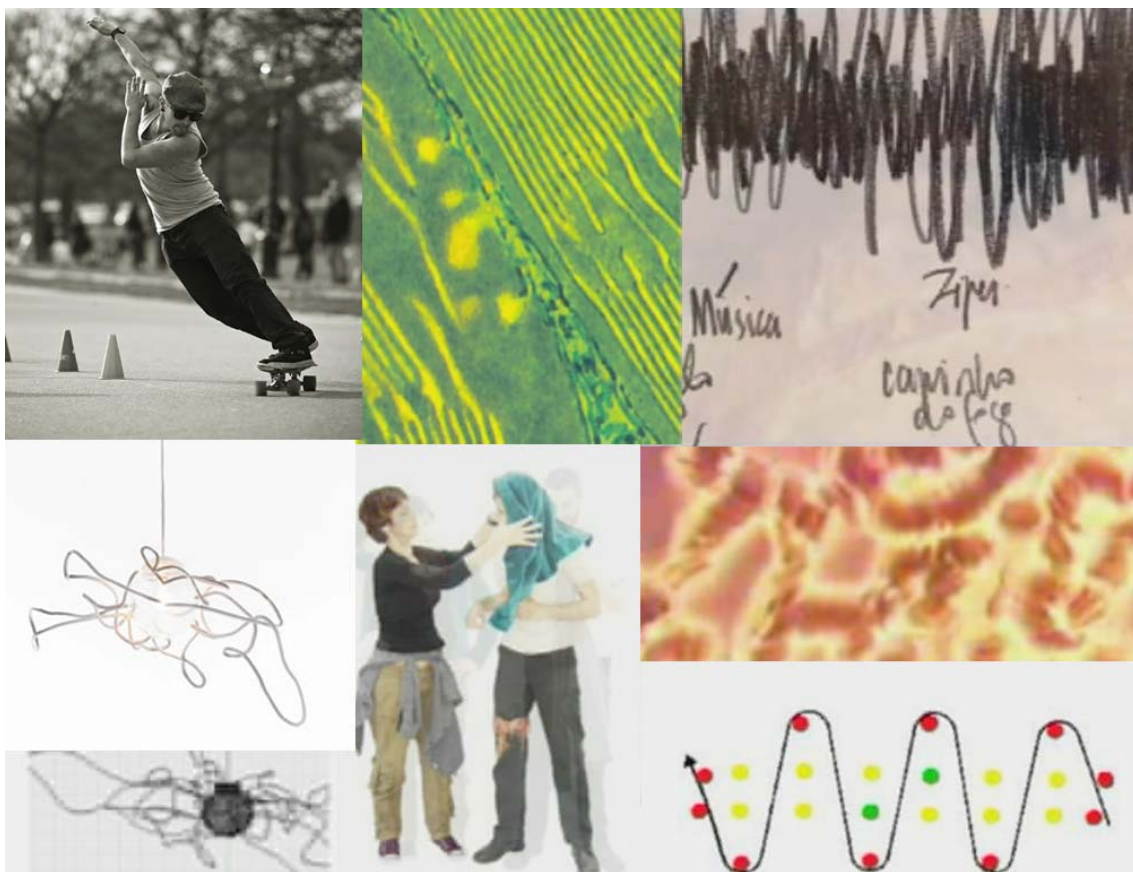
Figura 1 : colagem ziguezague 01 a partir do material audiovisual que acompanha o artigo.

Para pensar o significado de ziguezague, Deleuze 4 lembra o natural ZZZ da mosca e se refere a um fenômeno que ‘ninguém vê’ e se trata de uma ativação (?), uma costura (?) que se dá entre potenciais diferentes, capaz de promover uma reação visível: ‘um raio’ “que ilumina”.