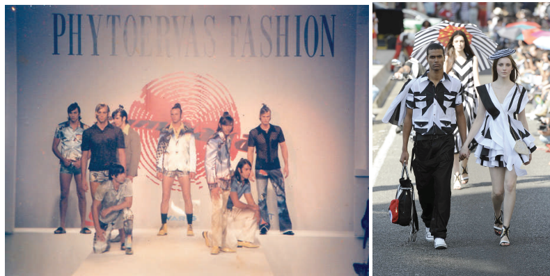
À esquerda: looks da coleção de estreia de Jum Nakao no Phytoervas Fashion Verão 1996. À direita: desfile-performance da coleção verão 2010 da grife paulista Cavaleira, realizado no Viaduto do Minhocão, na região central da cidade de São Paulo, em 21/06/2009.

Com isso, a expansão seria um percurso natural para o desenvolvimento de São Paulo, em inúmeras frentes, inclusive na indústria têxtil e, mais modernamente, na concepção de uma indústria de moda que se fortalece a partir da segunda metade do século XX e início do XXI. Dois princípios norteiam e justificam a escolha do tema Fashioning São Paulo: Metrópole, Cultura & Moda , a saber: primeiramente, o “amor ao saber (enquanto conhecimento teórico)”, que, aqui, inspira-nos em busca do conhecer a moda e sua interrelação com o estado e a cidade de São Paulo; e em um segundo princípio seria o de refletir e compreender as dinâmicas de relações existentes entre os conceitos de “metrópole”, “modernidade”, “cultura” e “moda” e como todos estes se entrecruzam nas produções artística, estética, cultural, mercadológica de bens da indústria da moda de São Paulo com a corroboração de sua indústria têxtil.