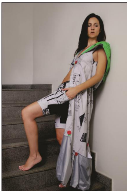
Fig.3- Modelo 1 prototipado

Pesquisar sobre a relação moda e comunicação forneceu aprendizado sobre sua importância e sobre os resultados que reflete na sociedade, mais especificamente na mulher mineira. Mais do que nunca se comprova que a moda possui várias vertentes por onde ela caminha na sociedade e por sua vez no comportamento do ser humano. A comunicação, nesse caso o jornal, exerce papel fundamental nesse processo uma vez que é o elo de ligação entre a leitora e o mundo subjetivo da moda. O caderno feminino & masculino do jornal Estado de Minas exerce com muita competência esse papel, atuando como hermenêuta, interpretando os sinais e transformações das sociedades modernas, todas movidas pela lógica da moda.