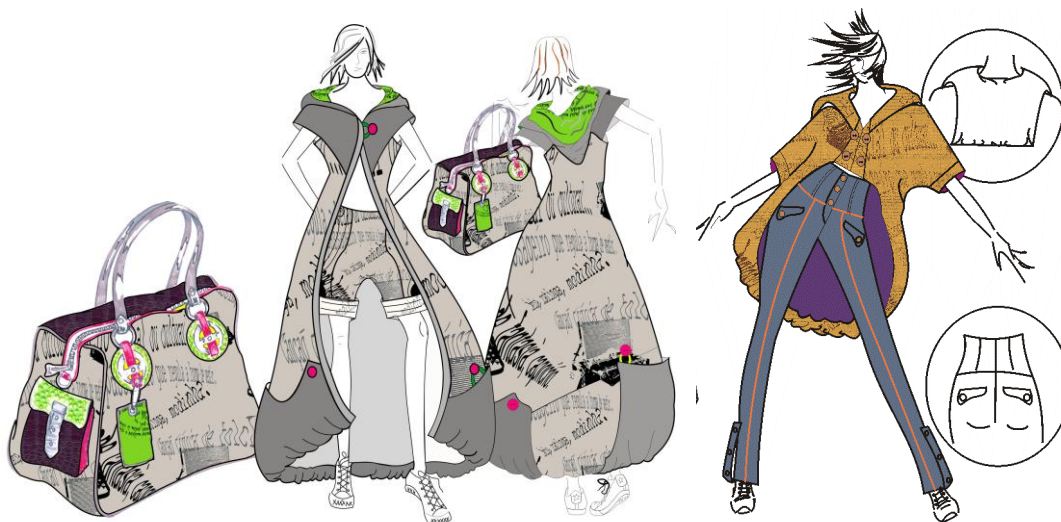
Fig. 2- Croqui família- moda e comunicação

A coleção foi dividida em três famílias sendo duas de roupas e uma de bolsas. Nessa etapa de geração de alternativas do produto foi desenvolvido croquis em desenhos de ilustração digitais na técnica de Corel Draw, detalhando estampas e cores a serem utilizadas.