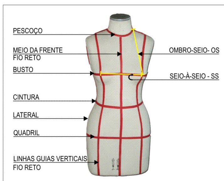
FIGURA 2: Manequim de “ Moulage ” com as marcações do corpo

Sobre os métodos científicos de aferição das medidas do corpo humano, discute-se entre a mensuração manual ou por “ body scanners ”. A escolha da melhor forma não é o objetivo de nossas reflexões neste trabalho. A maneira mais acessível para a determinação de tomada de medidas nas confecções de pequeno e médio porte (contingente importante no cenário nacional) ainda é a fita métrica usada há décadas pelas costureiras (milímetros). A grande preocupação é chegar-se a um consenso que produza uma tabela de medidas razoavelmente confiável, que possa orientar a confecção de modelagens o mais equilibradamente possíveis para os produtos do vestuário em todo o território nacional.