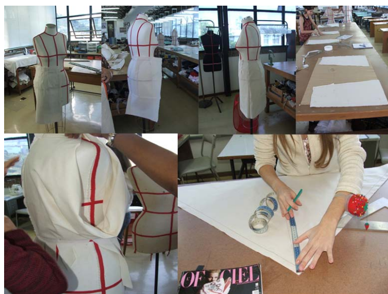
FIGURA 1 – Aula de “ moulage ”

Este expediente é usado no mundo inteiro, evitando-se assim enorme perda de tecido e os conseqüentes prejuízos. O argumento usado pelos confeccionistas é sempre o da perda de tempo com a confecção da tela, o que é um grande equívoco de enfoque. A tela testada antes da peça piloto, no algodão crú, tem seus ajustes e correções feitas neste momento, e a peça piloto definitiva sairá perfeita, performance que permanecerá em toda a grade da numeração pretendida, desde que feita com técnica adequada e eficiência.